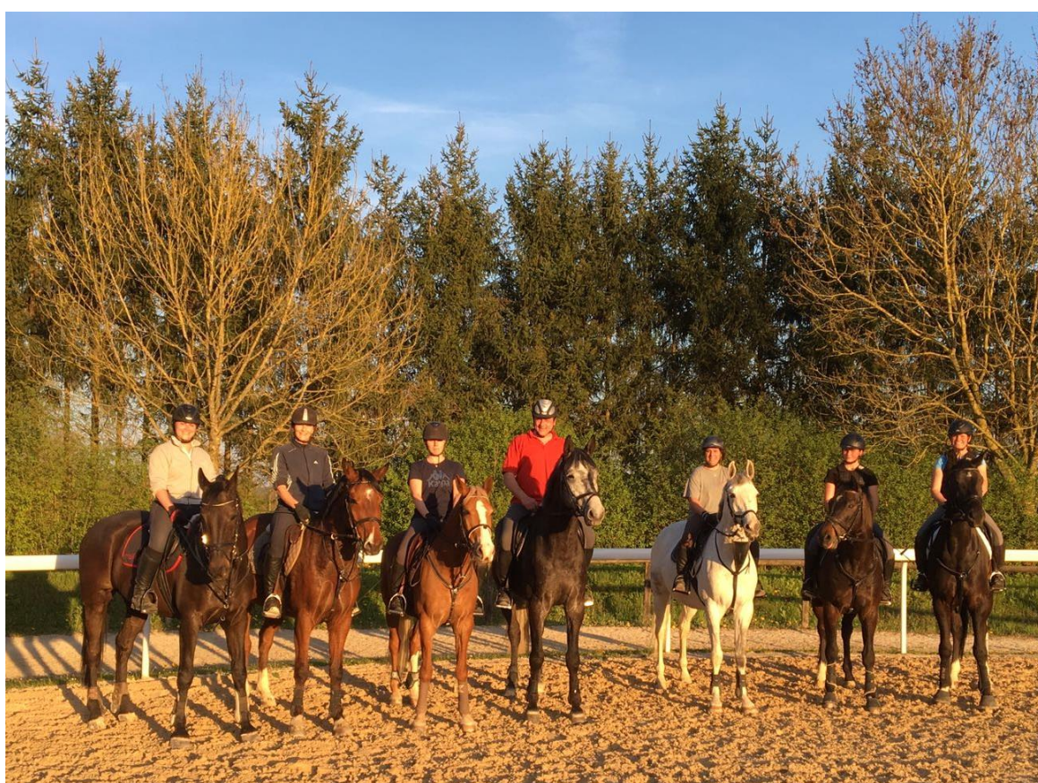
Teilnehmer Schlusspringen 2017